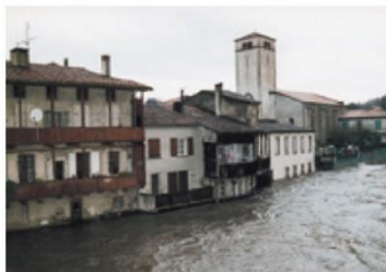
Bassin de l'Agout (décembre 96)