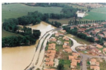
Bassin de l'Hers (juin 1992)