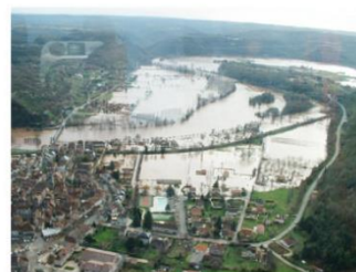
Bassin du Lot (décembre 2003)